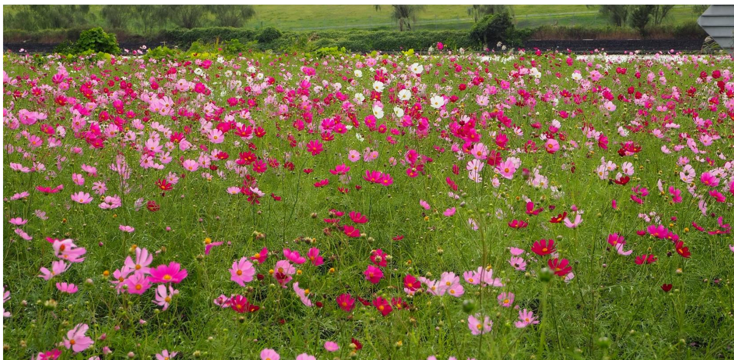
秋風にそよぐコスモス畑