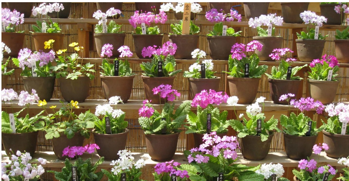
春の日差しが暖かい桜草の展示会